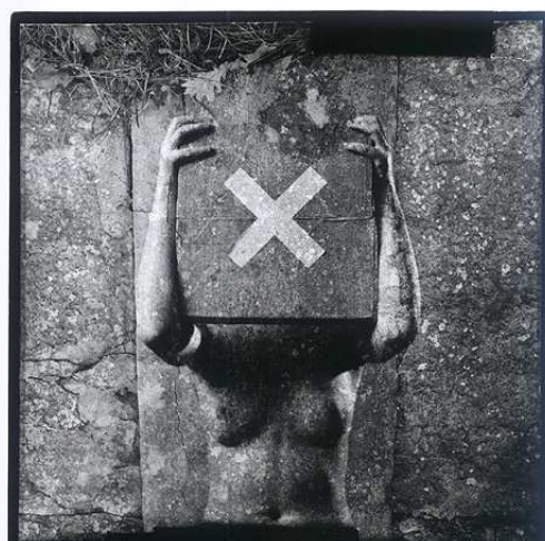
St. Kusiak 2002