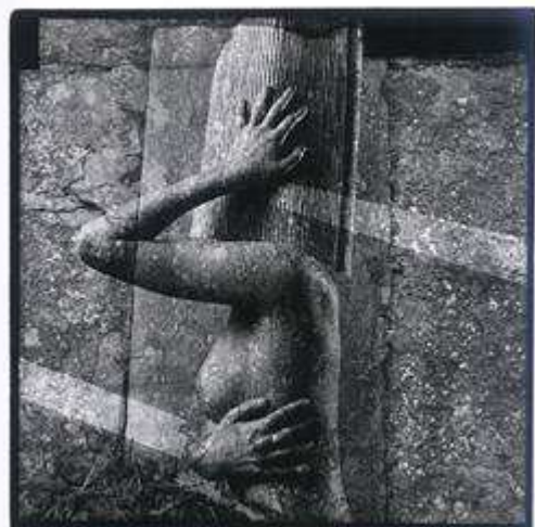
St. Kusiak 2002