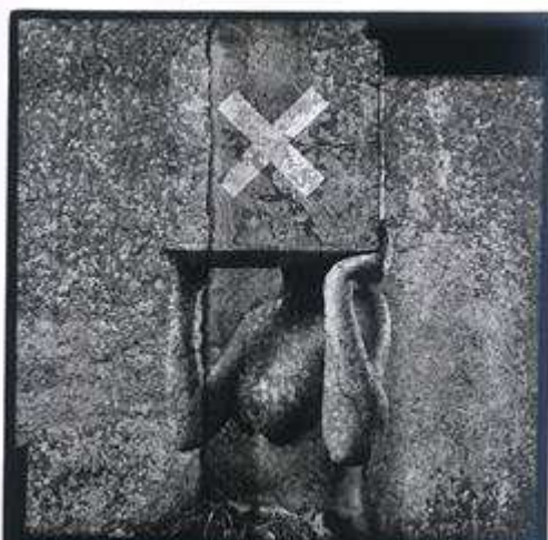
St. Kusiak 2002