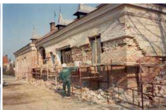
Zakliczyński Ratusz w trakcie remontu