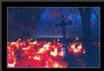
Fot St. Kusiak