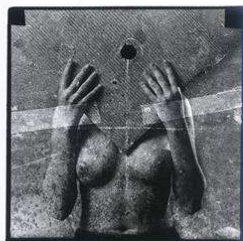
St. Kusiak 2002