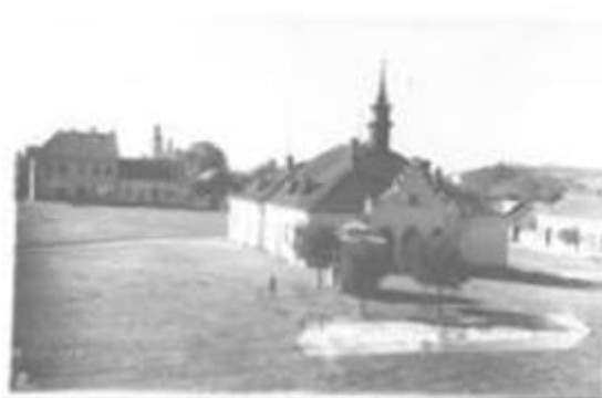
Ratusz przed remontem