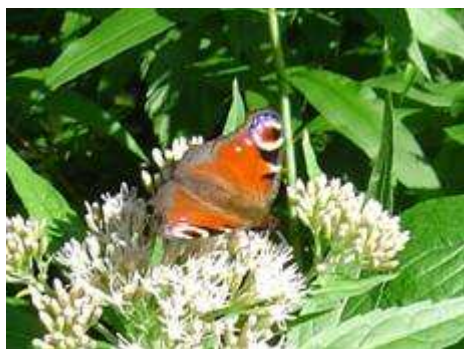
Rusałka pawik - Inachis io