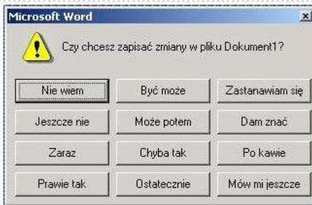
Program Word 2013 w wersji dla blondynki