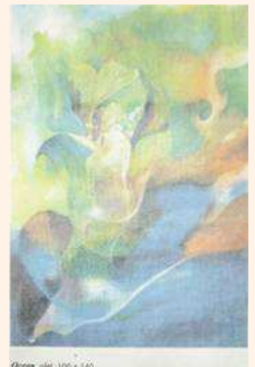
Obraz: olej, 100 x 140