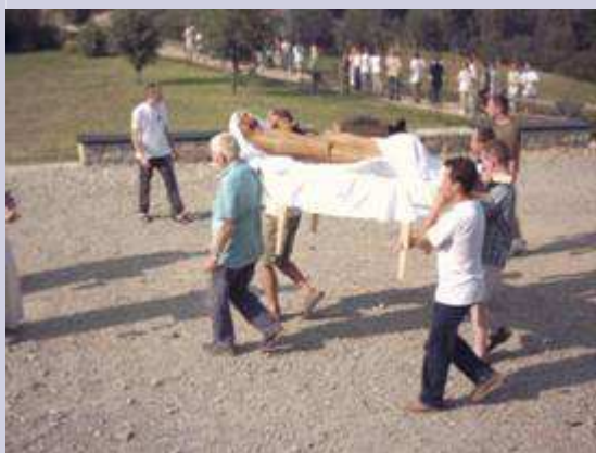
Figura Matki Boskiej niesiona na marach