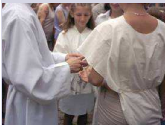
Rozścielajcie woń Chrystusa