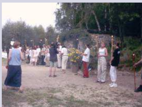
Przy symbolicznym grobie