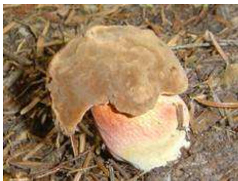
Borowik ceglastopory - Boletus erythropus