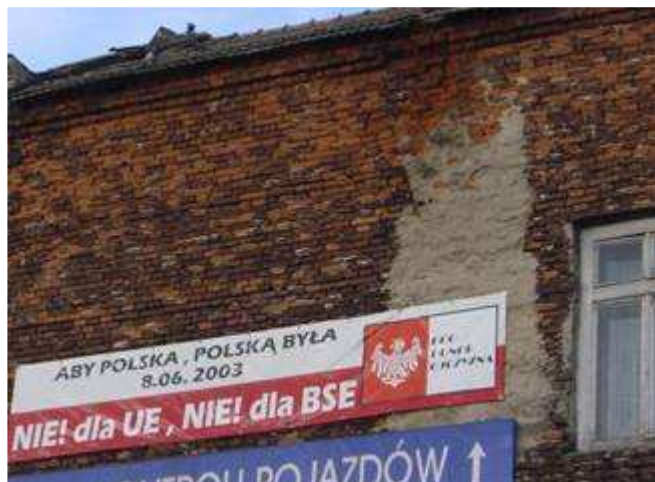
Zakliczyn, dom na ulicy Malczewskiego