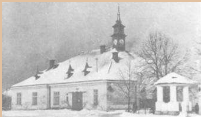
Tak wyglądał zakliczyński Ratusz przed remontem

różne materialne dowody dotyczące naszej zakliczyńskiej historii. Wyciągnijmy z szaf stare zdjęcia, szkice, pocztówki, ręcznie zapisane wspomnienia i inne materiały mówiące o życiu pokoleń, które już odeszły. Na pewno wśród tych wspomnień znajdzie się kolejny kronikarz podobny do Jędrzeja Mytnika z Filipowic. Nie pozwólmy, aby ta nasza wspólna historia, może nie aż tak ważna, ale dokumentująca zmiany wokół nas nie zginęła. Ze swojej strony możemy zaoferować prezentację tych materiałów, jak i ich cyfrową obróbkę. Wszystkich zainteresowanych proszę o kontakt z adresem: redakcja@zakliczyn.com.