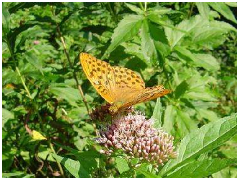
Dostojka laodyce - Argynome laodice - samiec