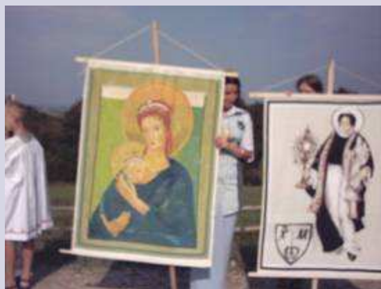
Matka Boska Niezawodnej Nadziei