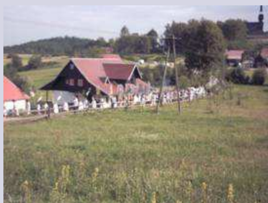
Procesja na tle Domu Kostka