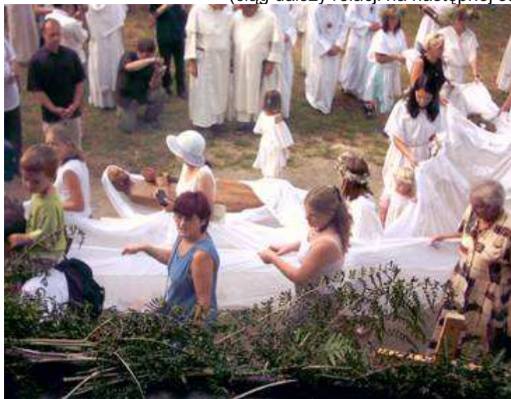
Uroczyste „pożegnanie” Matki Bożej

(ciąg dalszy relacji na następnej stronie)