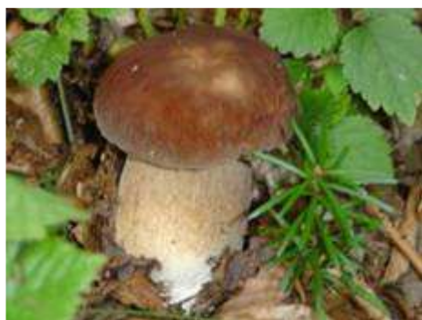
Borowik szlachetny - Boletus edulis