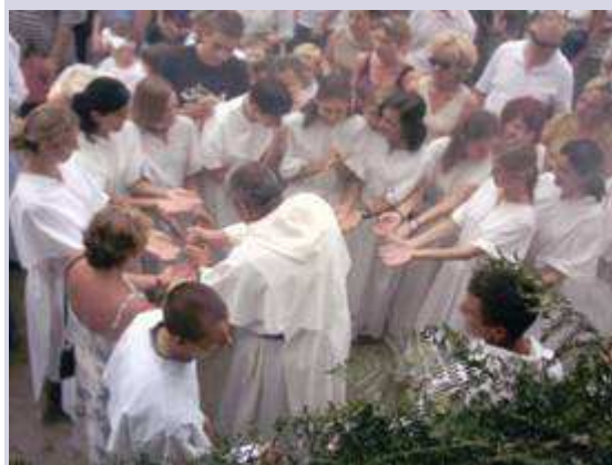
Wokół Ojca Góry